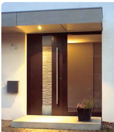
75 Drzwi wejściowe z charakterem

56 Przed wyborem projektu. Nowoczesne domy z dachami dwuspadowymi Popularność i różnorodność zawdzięczają nie tylko polskiemu zamiłowaniu do architektury stodołowej, ale przede wszystkim prawu, które w wielu regionach kraju narzuca obowiązek budowy domu z dachem spadzistym. Dużą rolę odgrywa