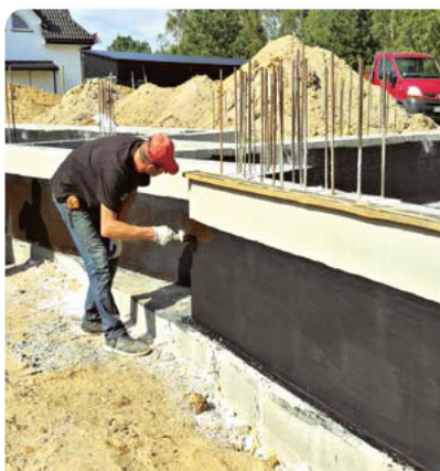
102 Budowa pod kontrolą

też zdroworozsądkowe podejście inwestorów, bo dwuspadowość dachu pozwala na ekonomiczne wykorzystanie poddasza.