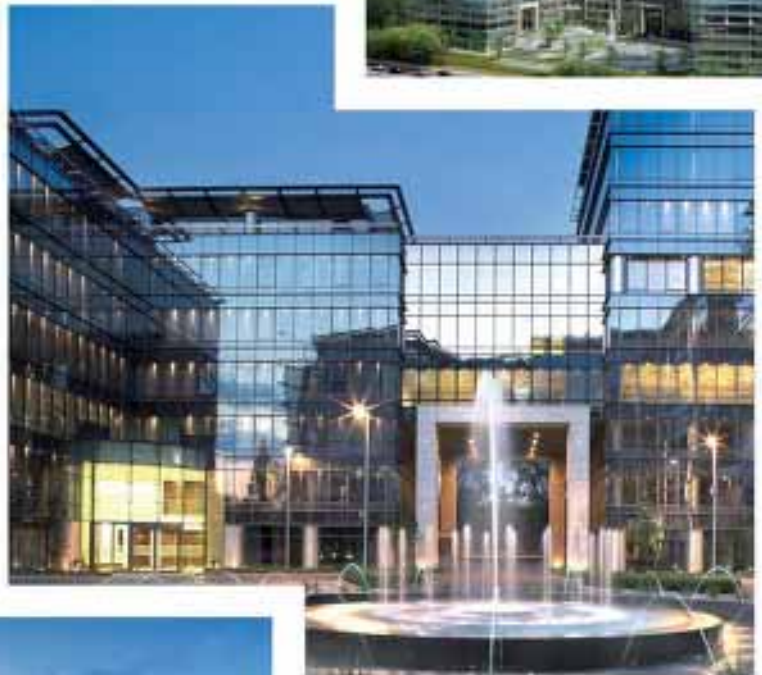
Marynarska Business Park, Warszawa